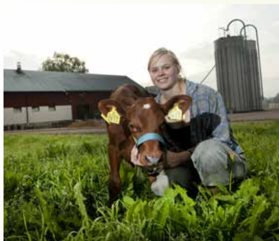
Bondgårdar med mjölkproduktion finns över hela landet.

Stora delar av vår mat har sitt ursprung i det svenska lantbruket. Från våra bondgårdar får vi även miljövänlig energi, skog som blir till byggnader och möbler, och ett öppet välkommande landskap med åkrar, ängar och betande djur.